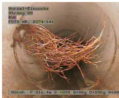
starker Wurzeleinwuchs aus Muffe