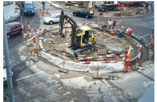
Kreisell im Bau

Auftraggeber Aargauer Baudepartement und Einwohnergemeinde Würenlos Tätigkeit der F. Preisig AG Projekt und Bauleitung Bausumme CHF 1.9 Mio. Bauausführung 2002 / 2003