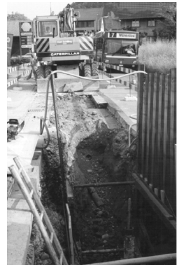
Enge Platzverhältnisse mit Busbetrieb